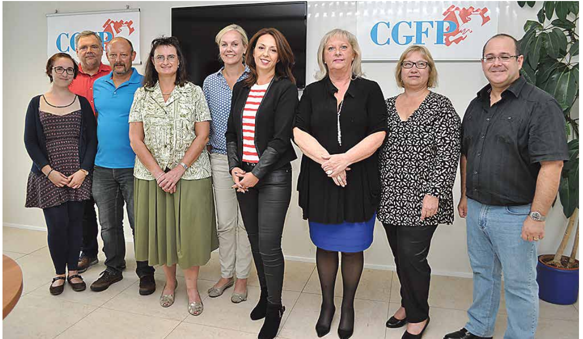
Comité à l'égalité des chances