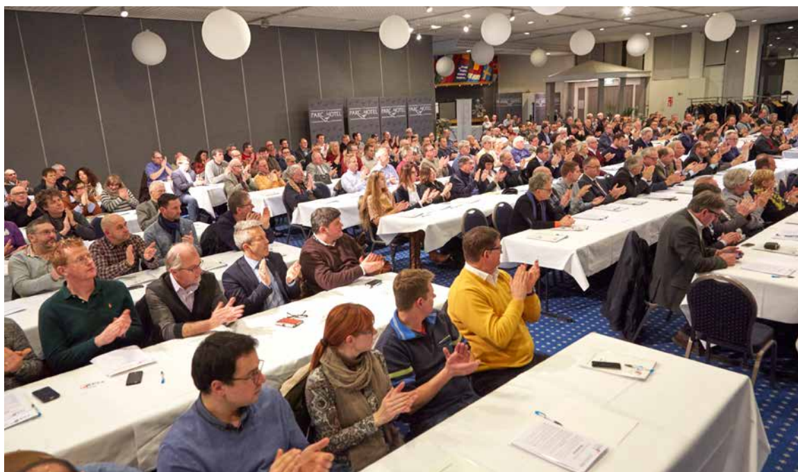
Conférence des Comités