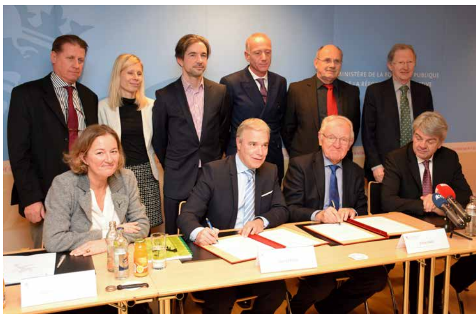
Signature de l'accord salarial

Vous trouverez l'accord tel que signé en annexe.