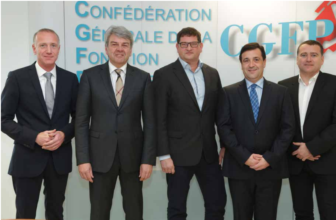
Le nouveau Bureau exécutif