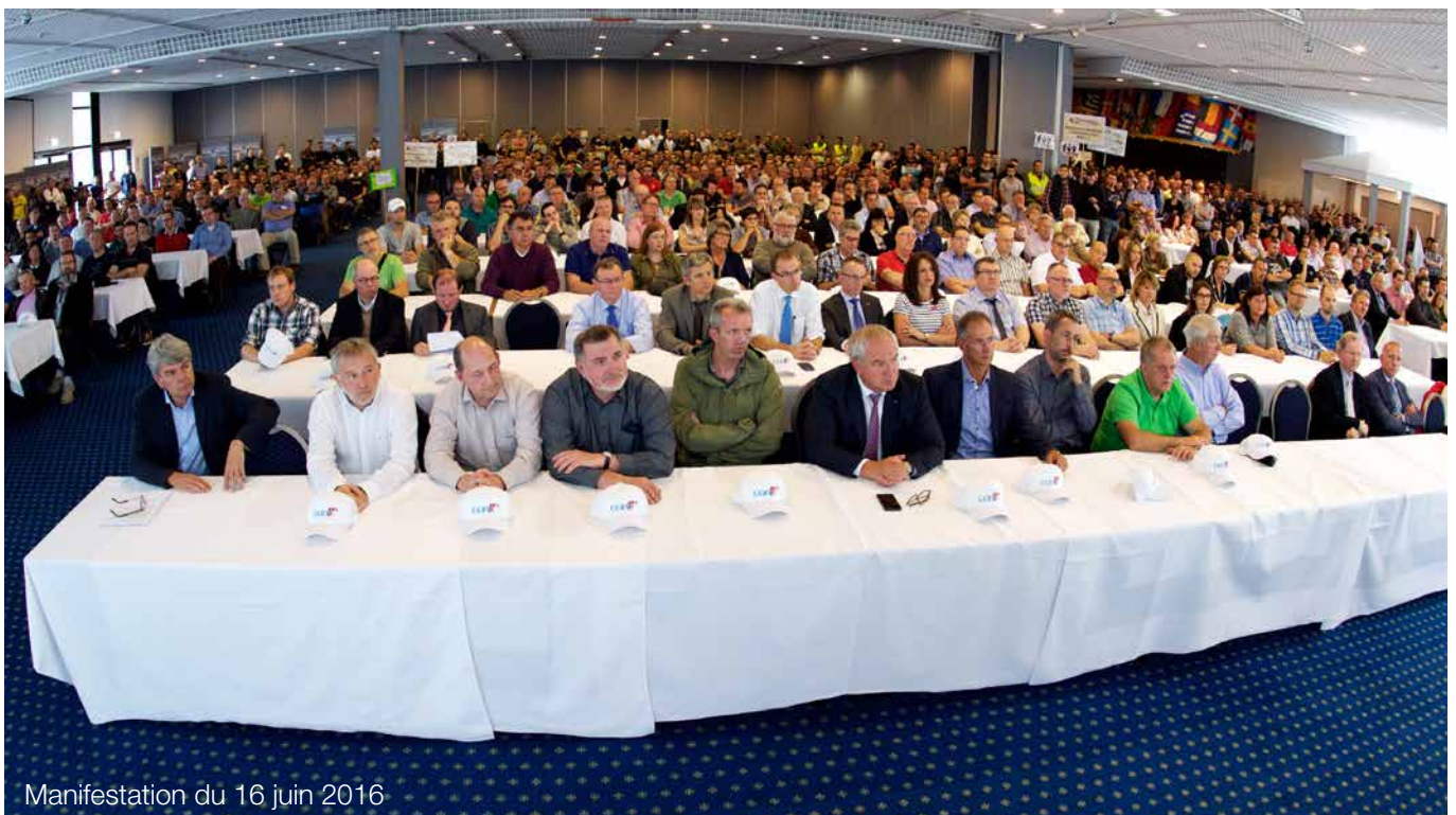
Manifestation du 16 juin 2016

A la suite de la manifestation, qui a connu un énorme succès, le ministre de la Fonction publique s'est officiellement engagé à ne pas toucher aux primes des agents de l'Etat au cours de la période législative actuelle.