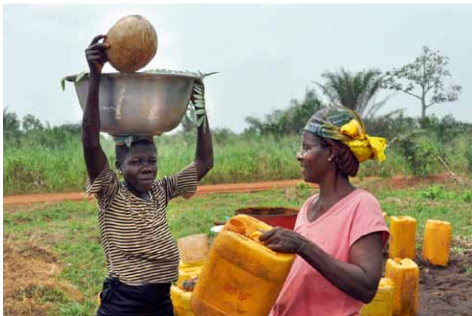
Seit Jahrzehnten schon unterstützt die CGFP Entwicklungshilfeprogramme in Millionenhöhe in aller Welt. Im LW war hiervon bislang recht wenig zu lesen.

Dann zum Thema Entwicklungshilfe: Natürlich begrüßt die CGFP alle staatlichen Förder-